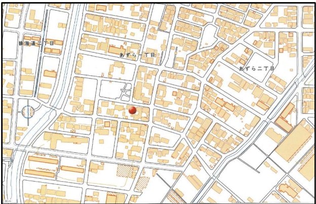
※国土地理院白地図をもとに(株)三昭堂編集作成